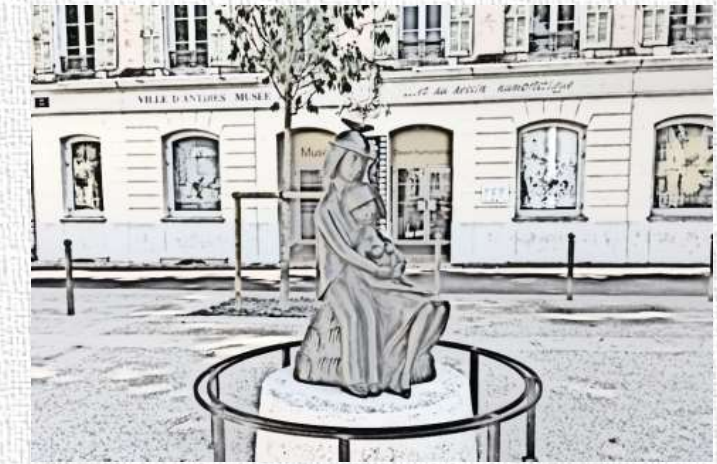
SAMEDI 21 NOVEMBRE 8H30-17H MUSÉE PEYNET DU DESSIN HUMORISTIQUE (ANTIBES) TARIF 10€