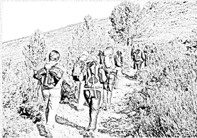
SAMEDI 5 DÉCEMBRE 13H30-17H RANDONNÉE TARIF 2€