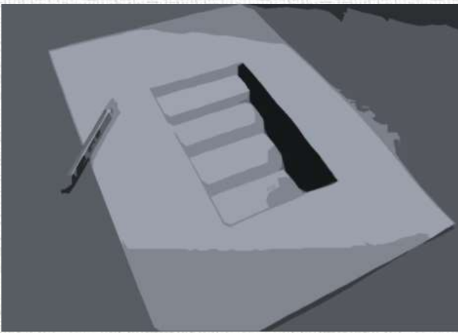
SAMEDI 3 OCTOBRE 10H-12H ATELIER DESSIN ILLUSION D'OPTIQUE (CSTO) TARIF 2€