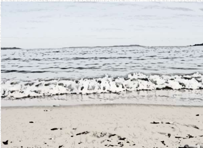
SAMEDI 28 NOVEMBRE 8H30-12H BALADE PIEDS DANS L'EAU (LA CAPTE) TARIF 2€