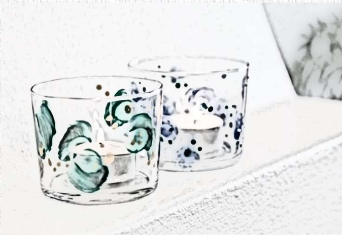
SAMEDI 7 NOVEMBRE 10H-12H ATELIER ART SUR VERRE (CSTO) TARIF 2€