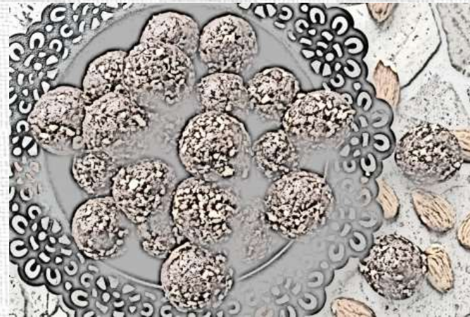
SAMEDI 12 DÉCEMBRE 14H-17H ATELIER CHOCOLATS ET PÂTISSERIES ORIENTALES (CSTO) TARIF 2€

Les inscriptions pour les activités du 3 octobre au 14 novembre auront lieu à partir du 16 septembre 2020. Pour les activités du 21 novembre au 1er décembre les inscriptions auront lieu à partir du 13 novembre 2020.