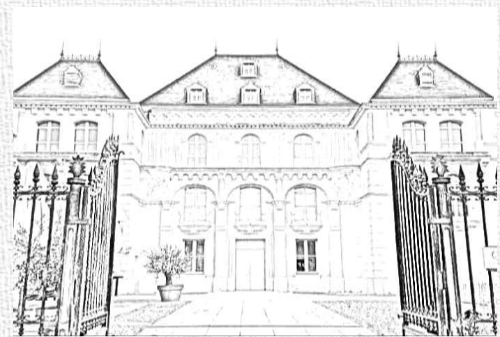
SAMEDI 14 NOVEMBRE 8H30-17H CHÂTEAU DE LA RUZINE (MARSEILLE) TARIF 10€