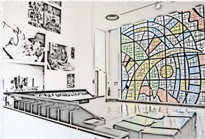
SAMEDI 10 OCTOBRE 8H30-17H VISITE GUIDÉE MUSÉE FERNAND LEGER (RIOT) TARIF 10€