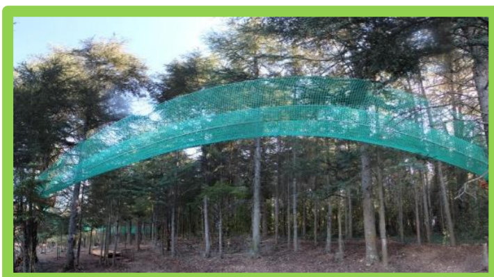
SAMEDI 15 JUIN 2019 À 9H « JOURNÉE PARC AUBRÉ FLASSANS-SUR-ISSOLE » 10€ ADULTE / 6€ ENFANT