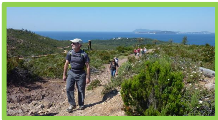
SAMEDI 8 JUIN 2019 À 9H « SUR LES HAUTEURS DE LA CADIÈRE D'AZUR » RANDONNÉE 2€