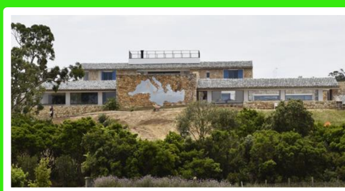
SAMEDI 18 MAI 2019 DE 8H30 À 18H « FONDATION CARMIGNAC VISITE GUIDÉE ET RANDONNÉE » 25€ LA JOURNÉE PORQUEROLLES