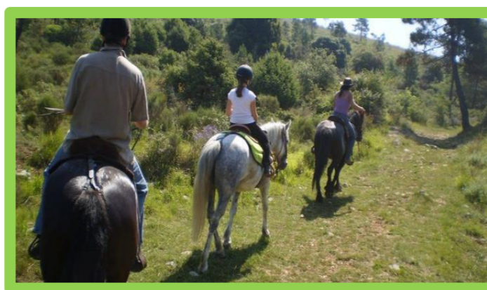
SAMEDI 11 MAI 2019 DE 9H À 12H « RANDONNÉE EQUESTRE LE BRUSC » 20€