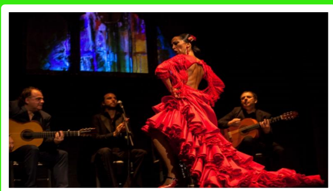
SAMEDI 4 MAI 2019 À PARTIR DE 10H JOURNÉE FESTIVE FLAMENCO TOULON EST INITIATION DANSE/REPAS ET SPECTACLE « LE PRIX SERA COMMUNIQUÉ ULTÉRIEUREMENT »