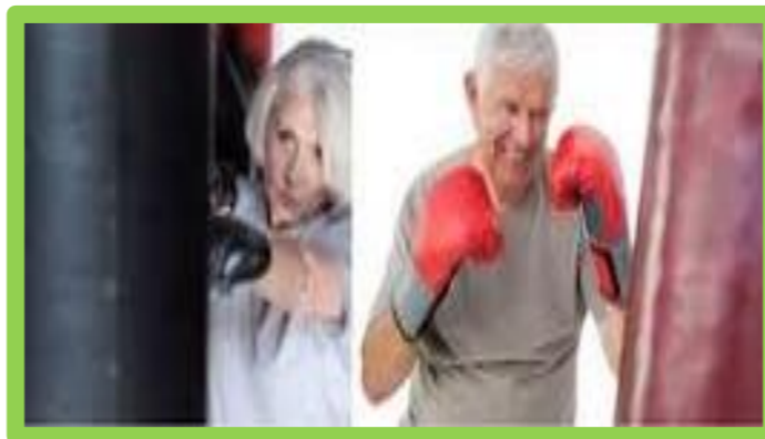
SAMEDI 4 MAI 2019 À 14H « INITIATION BOXE » 2€