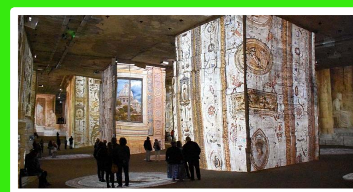
SAMEDI 1 ER JUIN 2019 DE 9H À 17H CARRIÈRES DE LUMIÈRES BAUX DE PROVENCE 20€ LA JOURNÉE