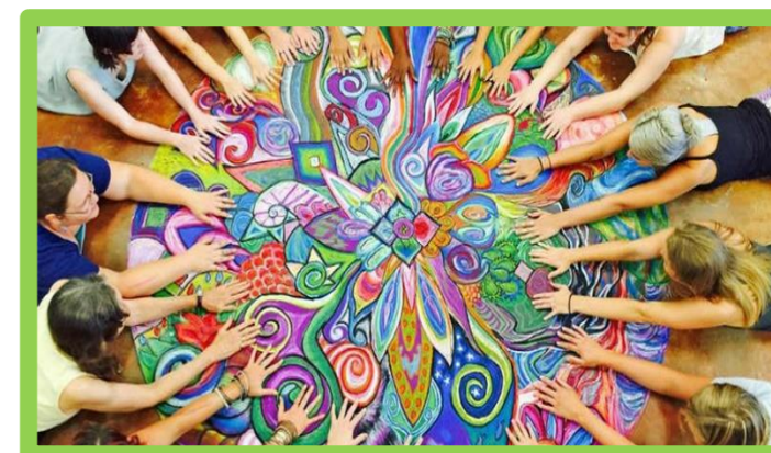
SAMEDI 25 MAI 2019 À 13H30 « ART THÉRAPIE AU CSTO » 2€