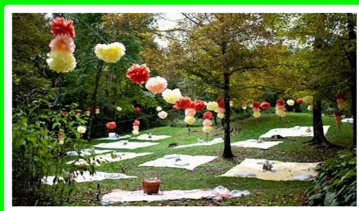
SAMEDI 29 JUIN 2019 À PARTIR DE 12H « GARDEN PARTY AVEC L'ÉQUIPE DU CSTO ET PÉTANQUE » SUR INVITATION