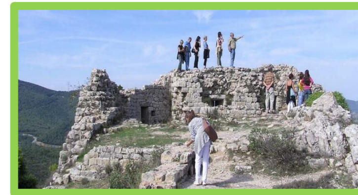
SAMEDI 25 MAI 2019 À 9H « RUINES DE SAINT SAUVEUR ROCBARON » RANDONNÉE 2€