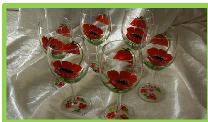
SAMEDI 8 JUIN 2019 À 13H30 « PEINTURE SUR VERRE AU CSTO » 5€