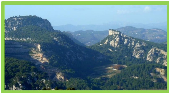
SAMEDI 27 AVRIL 2019 À 9H « SUR LES HAUTEURS D'OLLIIOULES DEPUIS CHATEAUVALLON » RANDONNÉE 2€