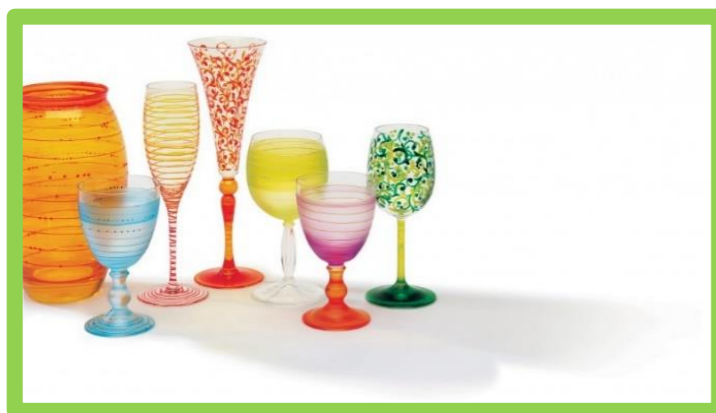
SAMEDI 27 AVRIL 2019 À 13H30 « PEINTURE SUR VERRE AU CSTO » 5€